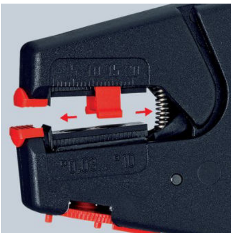
12 40 200: Nastavitelný délkový doraz