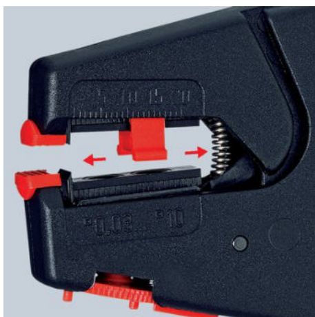
12 40 200: Nastavitelný délkový doraz