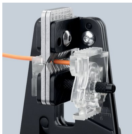
Čisté naříznutí izolace po celém obvodu