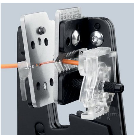
Tvarově se přizpůsobující odizolování díky precizním profilům nožů

Kapton® je registrovaná značka zboží E. I. du Pont de Nemours and Company Radox® je registrovaná značka zboží Huber & Suhner AG