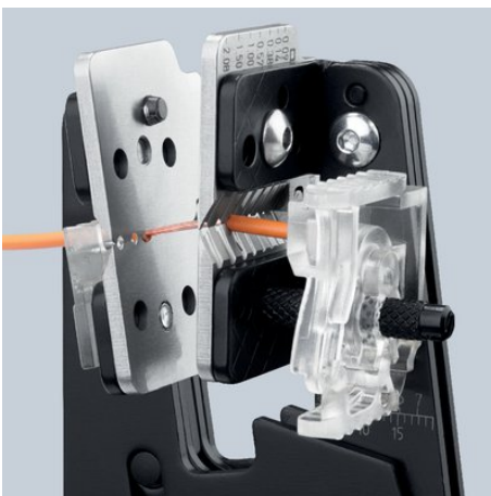
Tvarově se přizpůsobující odizolování díky precizním profilům nožů

Kapton® je registrovaná značka zboží E. I. du Pont de Nemours and Company Radox® je registrovaná značka zboží Huber & Suhner AG