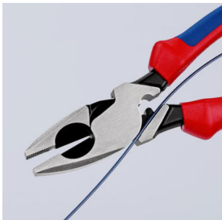
09 11/12 240: vťahovací prípravok na kably v mezeře kloubu