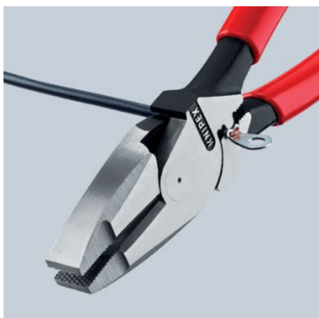
09 11/12 240: S univerzálním trnovým místem pro krimpování pod kloubem