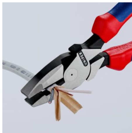
Dlouhé břity k řezání plochých kabelů