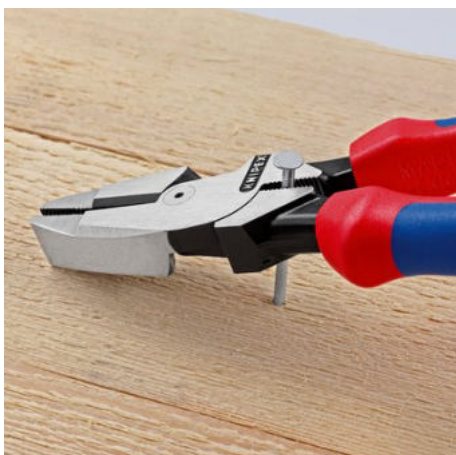
Upínací zóna leží pod kloubem za účelem silného páčícího účinku