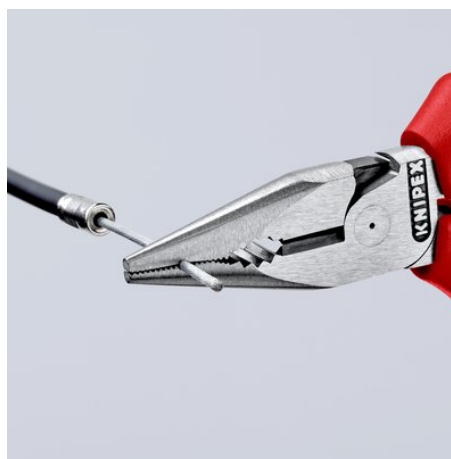
bezpečné uchopení i plochých dílců následkem tří-bodového dosednutí