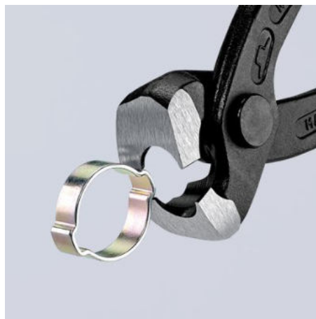
Utěsnění hadice na kapaliny na hrdle pomocí bočních čelistí