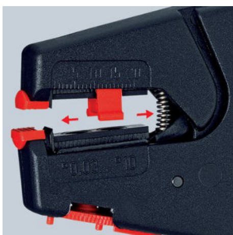
12 40 200: Nastavitelný délkový doraz